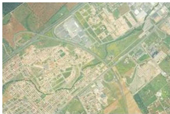
Figura 3. Marratxí (Mallorca) 1956-2000.