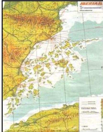
Figura 4. Proyecto Balear Cyclades.