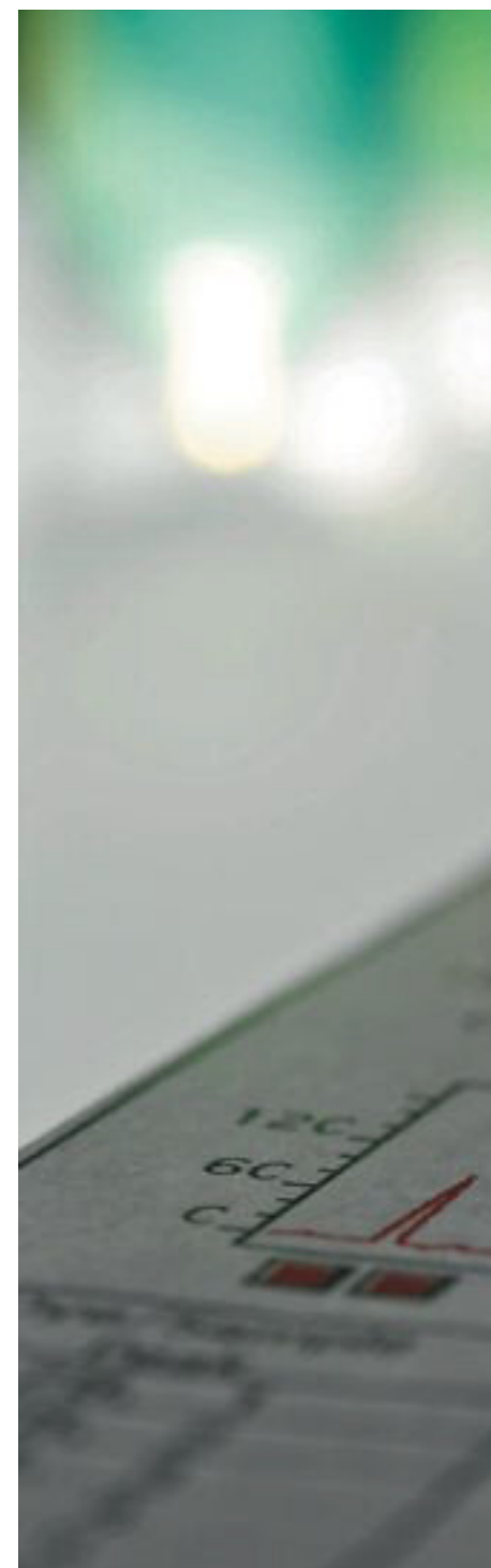
Una investigación impulsada por el Congreso de EE UU sacó los colores a cuatro de las principales empresas de este negocio.

Los test mezclan marcadores de ambos tipos, aunque la valoración de la importancia de cada uno no siempre es acertada